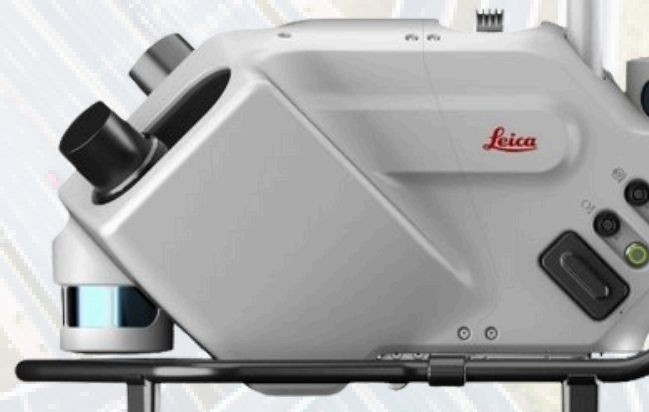
Leica Pegasus TRK Evo