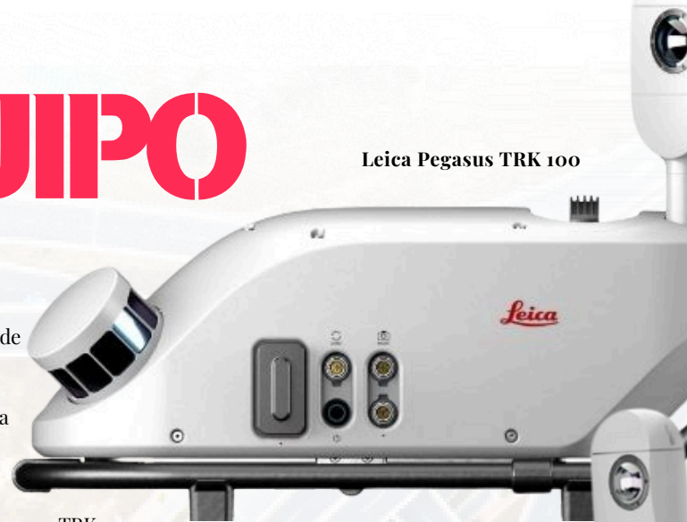
Leica Pegasus TRK 100

Y el otro modelo es el TRK Evo, cuyo enfoque principal es proporcionar la máxima precisión con diversas mejoras en tecnología, como dos escáneres láser de mayor alcance y con sensores laterales duales. Su densidad de nubes de puntos es mucho mayor y su velocidad de escaneo es de 4 millones de puntos por segundo. Construido para tener un excelente rendimiento en actividades como el análisis estructural, estudios ferroviarios y demás aplicaciones de exigencia en ingeniería.